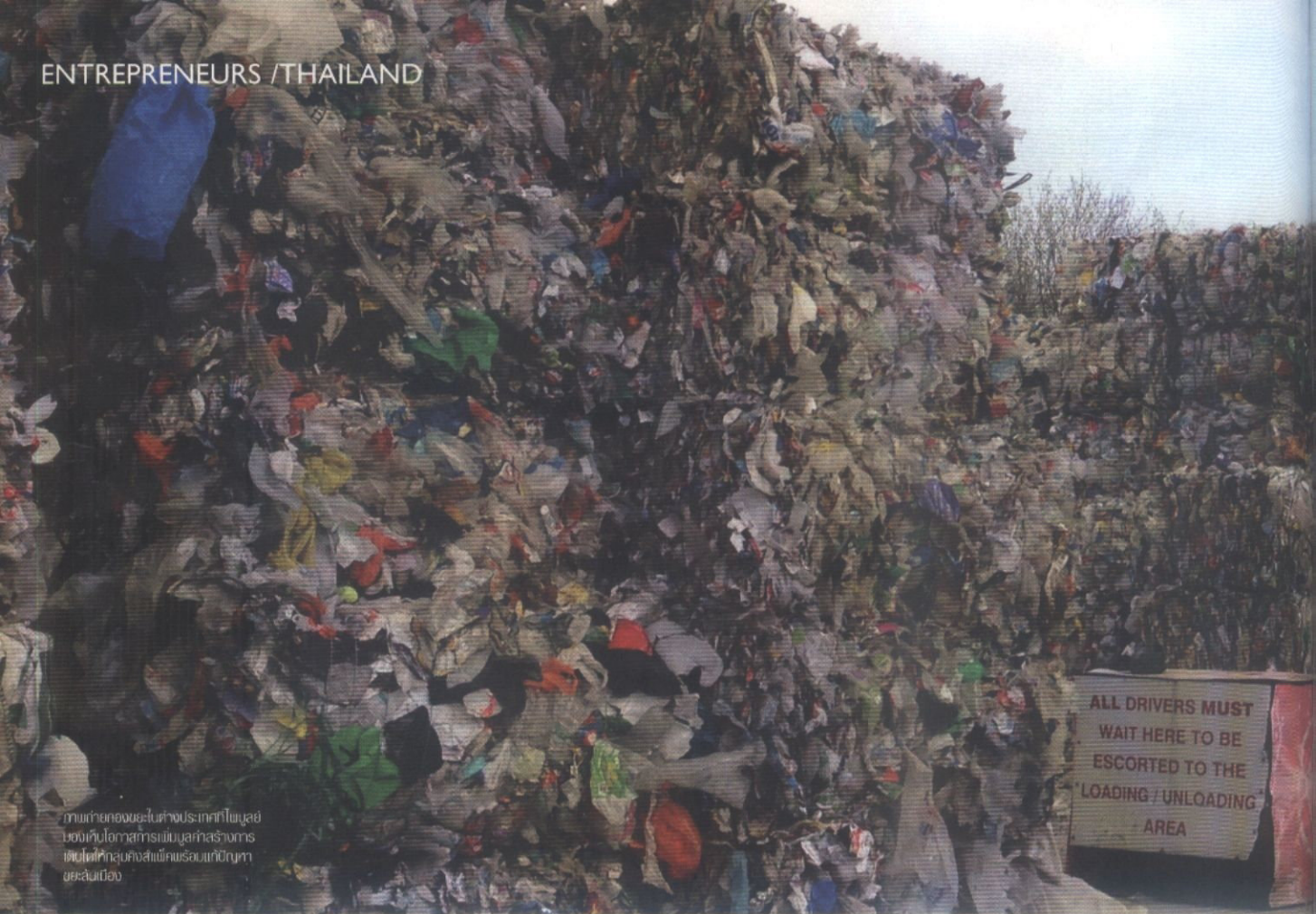
ภาพถ่ายของขยะในต่างประเทศที่ไพลอย ของกับโถงสารเคมีและสารเคมี ที่ขังไว้ที่กลุ่มคลังขยะที่รวมเก็บปัญหา ขยะในเมือง